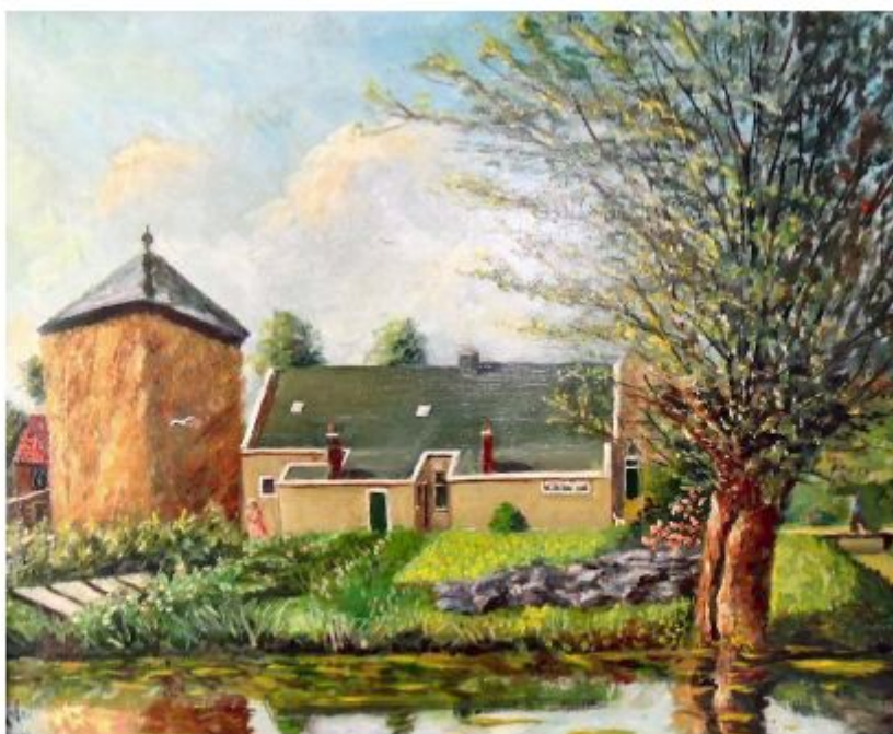
Inmiddels afgebroken boerderij van fam. Segers, 's-Gravenweg 105, R. Visser 1961 (collectie C. Segers, Woerden, foto Elly van Gelderen)

Open middagen Oudheidkamer (14-17 uur): 2/11, 7/12, 4/1 en 1/2